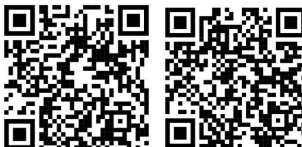
Videós útmutató QR-kódja